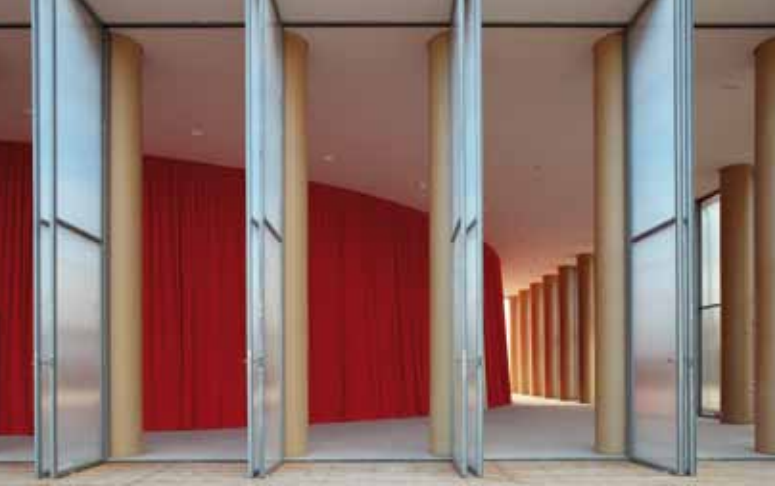
Soziales Engagement gepaart mit innovativer Baukunst: Shigeru Ban baut mit einfachsten Mitteln eine hoch funktionale Architektur.