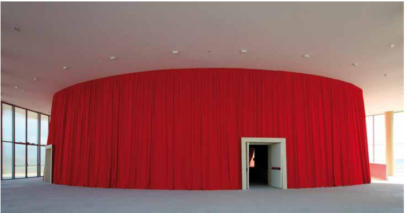
Die quadratische Halle wird diagonal von einem elliptischen, mit rotem Tuch bekleideten Saal geschnitten.