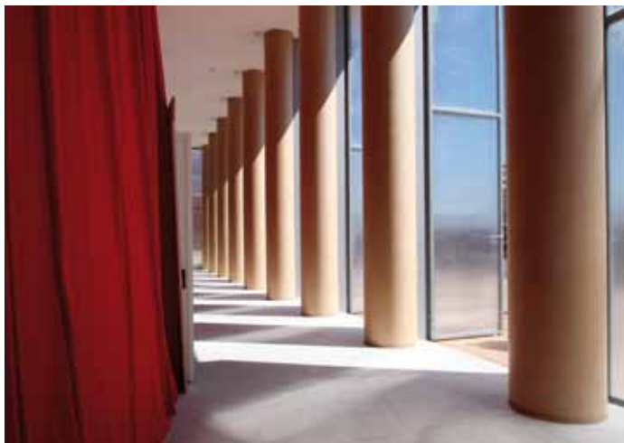
Zwischen den günstigen, tragenden Kartonsäulen fällt viel Tageslicht in den Eingangsbereich.