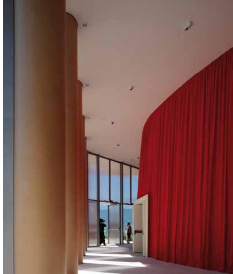
Foyerseitig bedeckt ein roter Vorhang die aus Sandsäcken gefüllte Stahlgerüstwand des Konzertsaals.