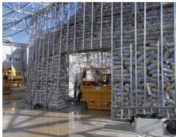
Die ovale Tragstruktur aus Stahlgerüsten wurde mit Sandsäcken gefüllt, die als Schallschutz dienen.

L'Aquila hat eine Bevölkerung von etwa 73'000 Menschen, und circa 30 Prozent davon besteht aus Studenten der Universität, des Musikkonservatoriums und anderer, die mit diesen Instituti-